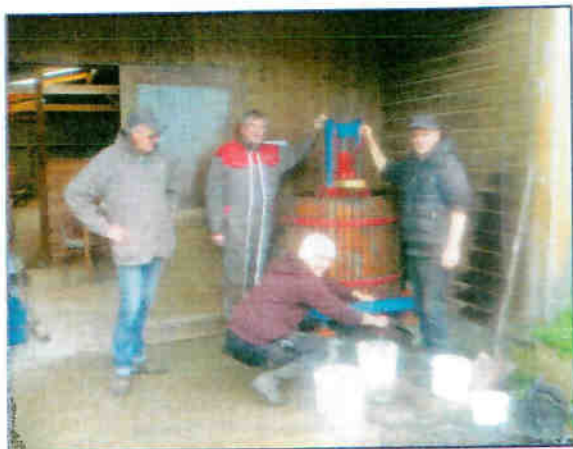
Atelier jus de pommes