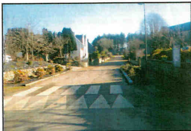
03 décembre 2019, fraîcheur et soleil.

Je vous invite toutes et tous à la cérémonie des vœux qui se déroulera le samedi 11 janvier 2020 à 15 heures à la salle polyvalente.