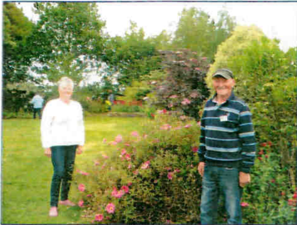
Journées Jardins Fleuris