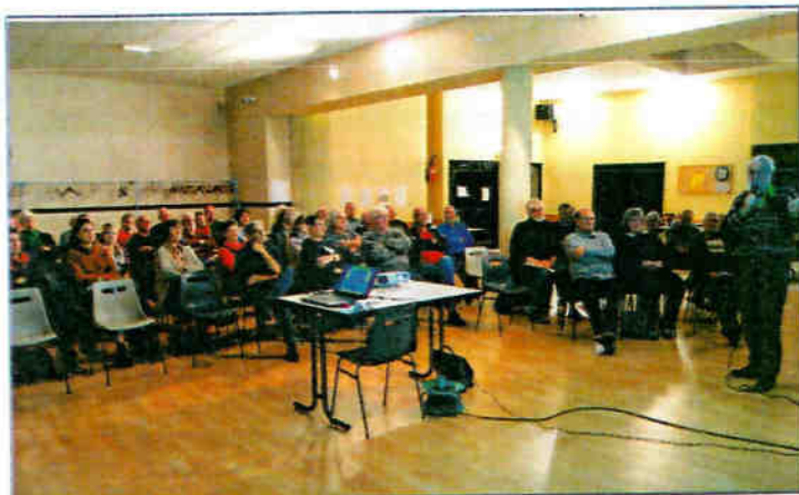
Réunion « Linky »